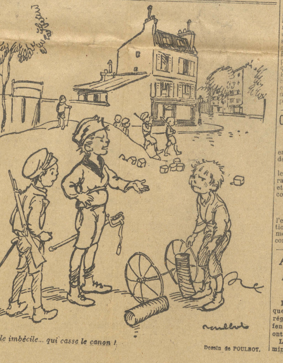
Ce sale imbécile... qui casse le canon !

EN 2 e PAGE : L'INTERROGATOIRE DE M. MALVY DEVANT LA HAUTE-COUR