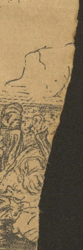
— Encore quelqu...