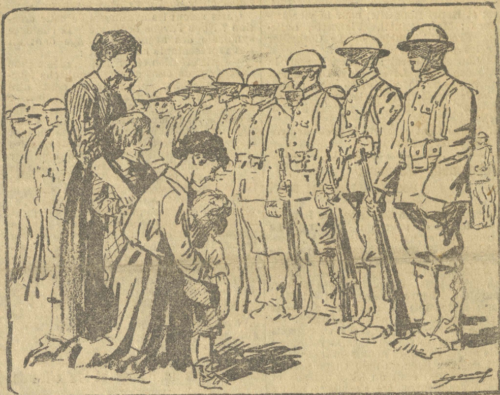
LES MAMANS. — Regardez-les bien, mes petits. Ce sont les vengeurs!